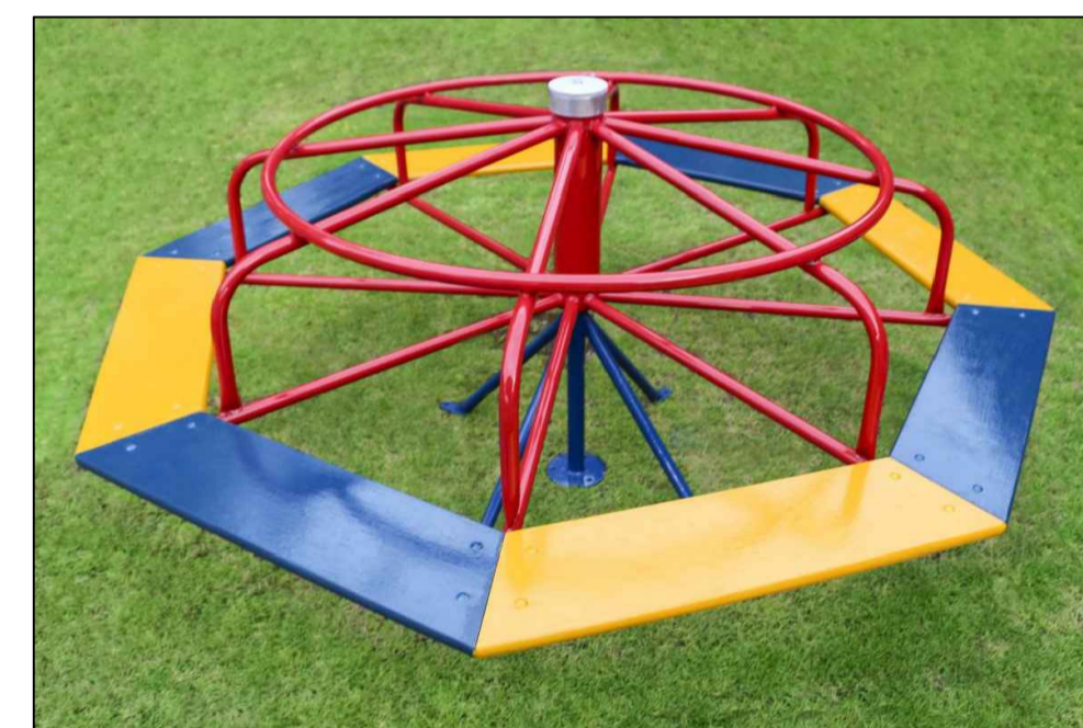
03_ Gira gira