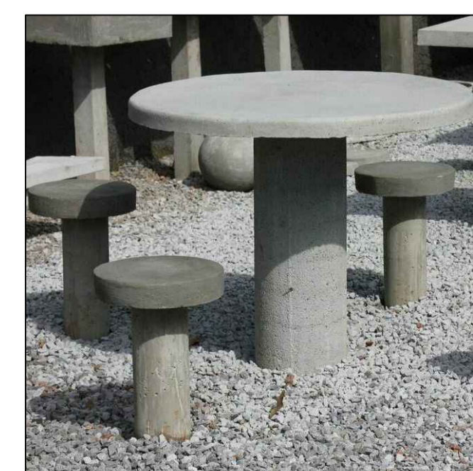
10_ Mesa concreto+4 bancos