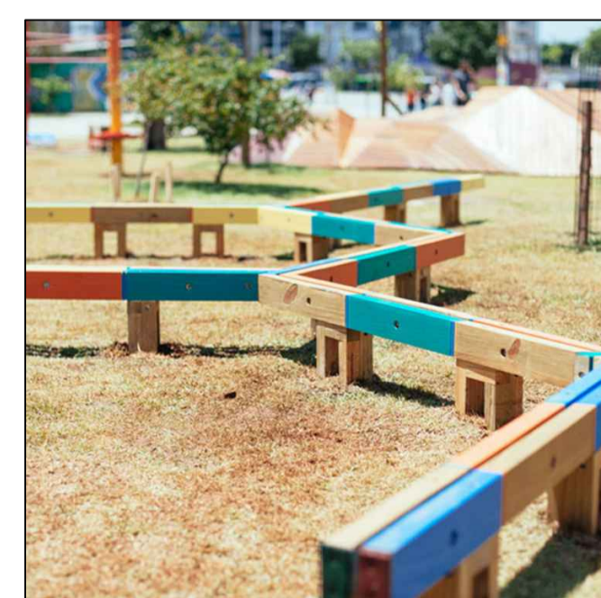
08_ Trave equilibrio