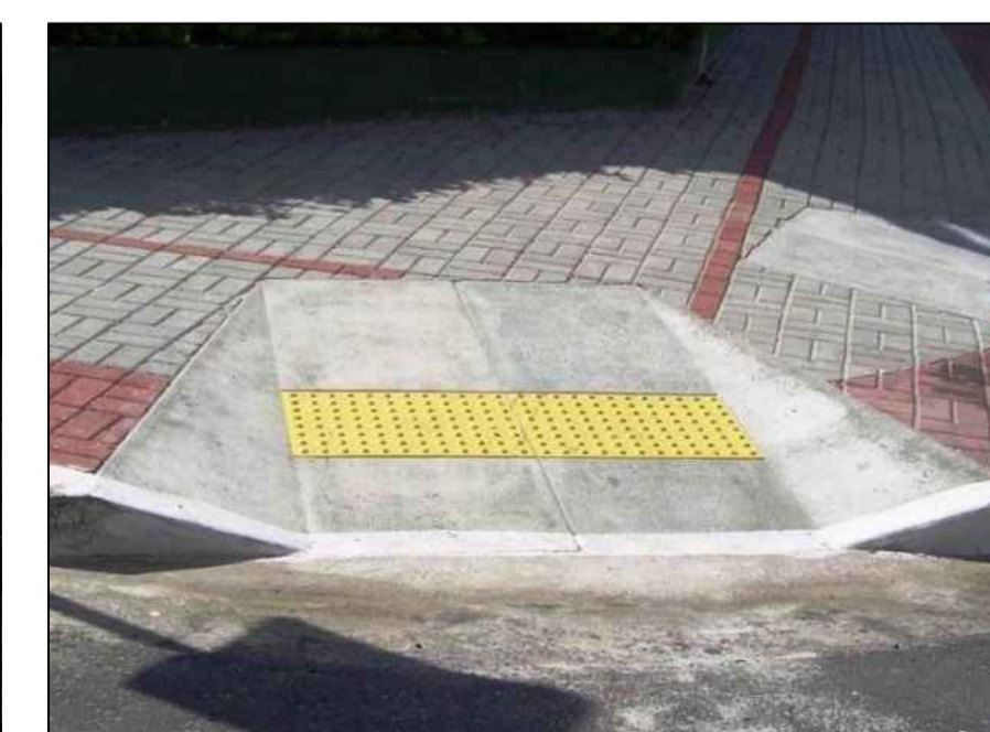
11_ Rampa/ acessibilidade