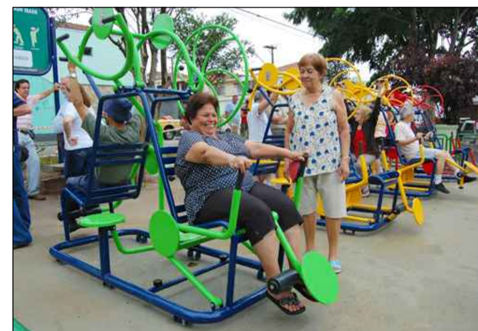
01_ Academia terceira idade