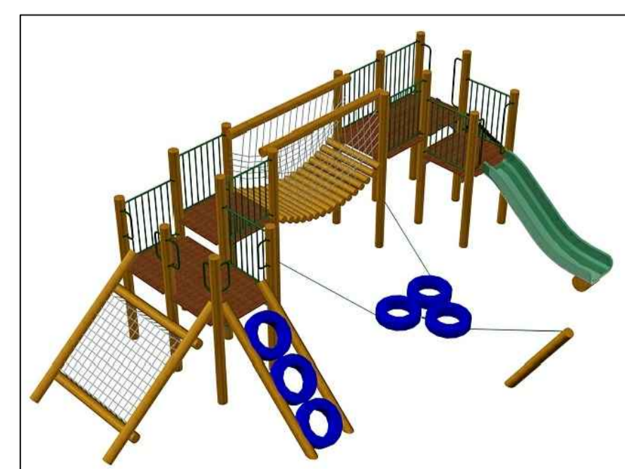
07_ Centro de atividades