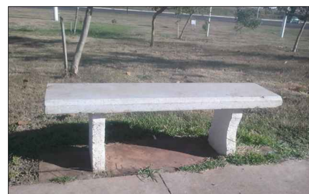
09_ Banco concreto