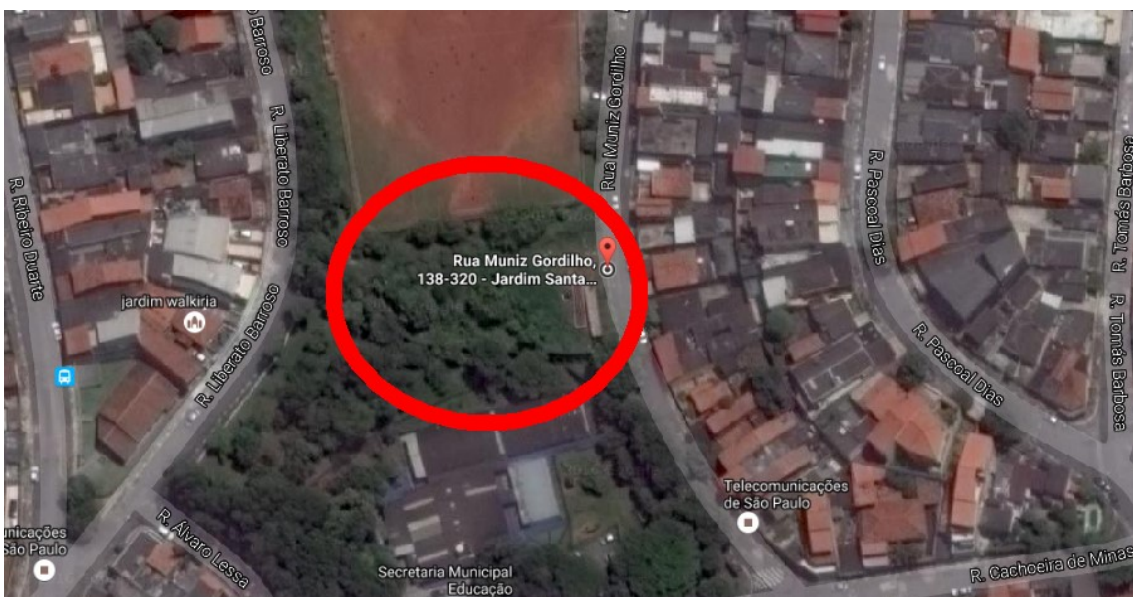
Figura 4 – Área 1 – Vista Superior da área indicada – Rua Muniz Gordilho;