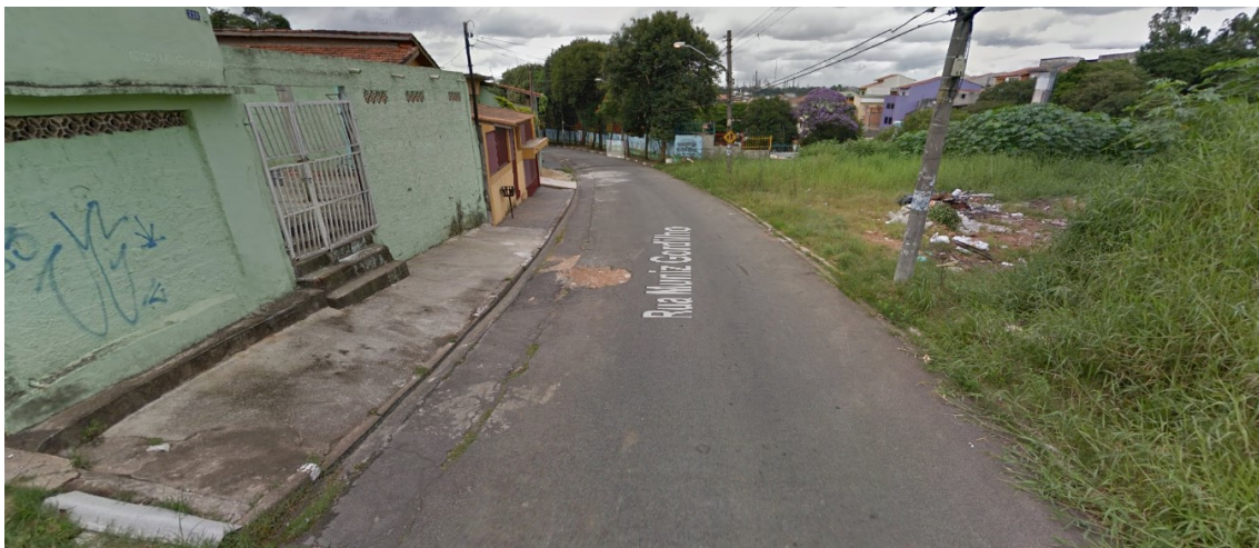
Figura 3 – Área 1 - Terreno localizado na Rua Muniz Gordilho;