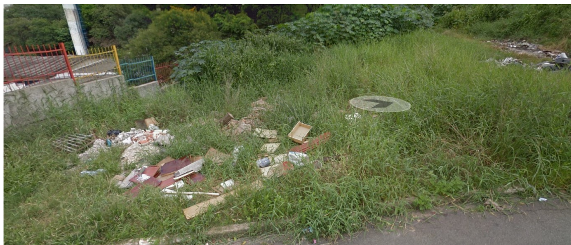
Figura 1 – Área 1 Terreno localizado na Rua Munis Gordilho, em frente ao número 253;

Área 2 - Ao lado esquerdo (figuras 5 ) existe a EMEI Ataufo Alves, localizada na Rua Cachoeira de Minas, 172, esquina com a Rua Munis Gordilho;