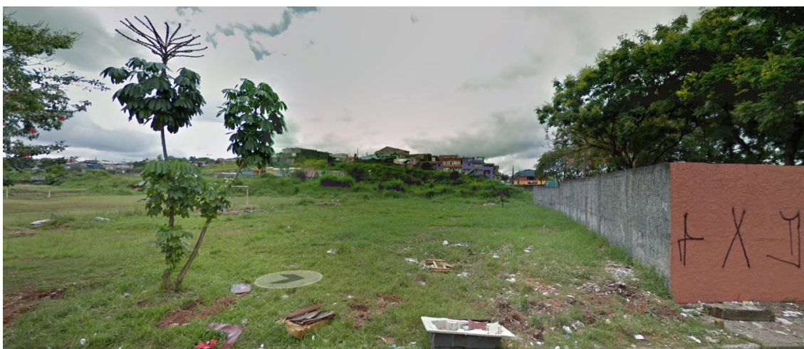
Figura 7 – Área 2 – Campo de Futebol localizado na Rua Gastão de Almeida;