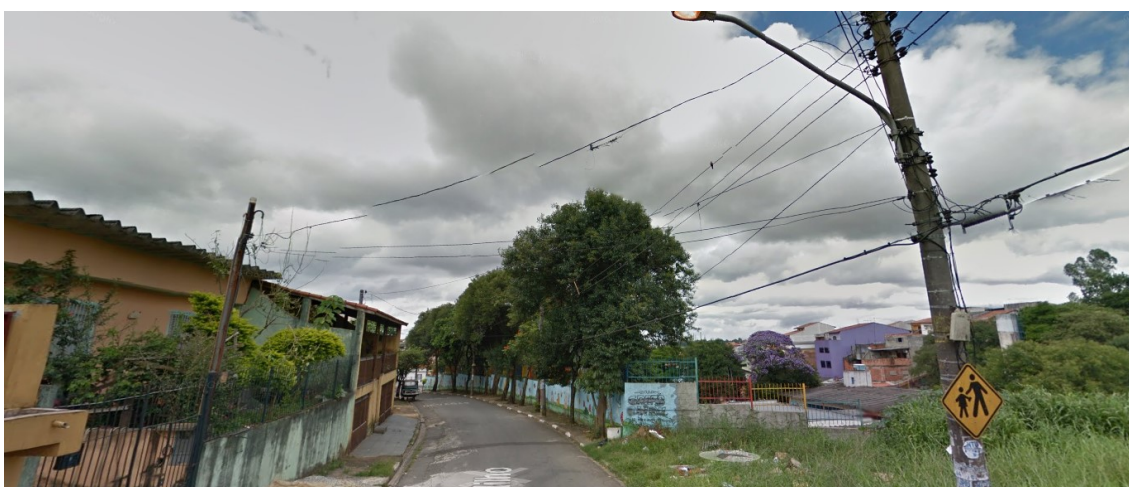
Figura 6 – Área 1 - EMEI Ataufo Alves;