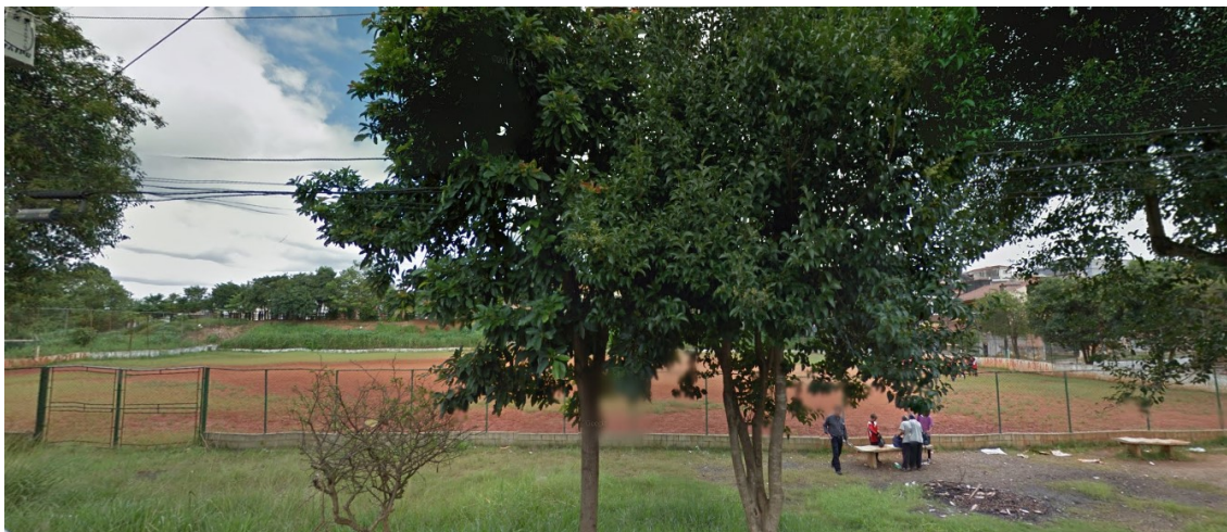
Figura 5 – Área 1 - ao lado direito deste terreno existe um campo de futebol;