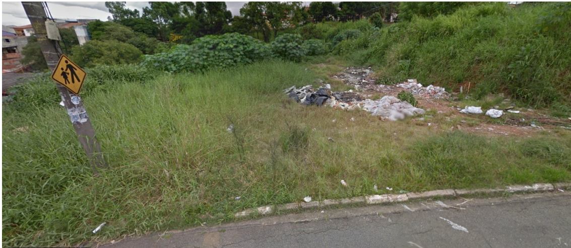
Figura 2 – Área 1 - Terreno localizado na Rua Muniz Gordilho, em frente ao número 253;