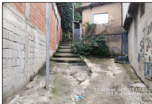
IMAGEM 8 - TRAVESSA SÃO JOAQUIM