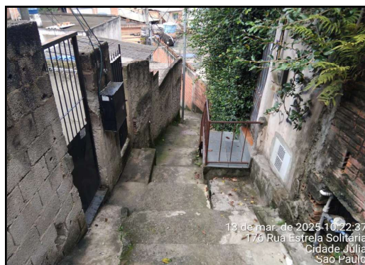
IMAGEM 6 - TRAVESSA SÃO JOAQUIM