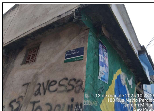
IMAGEM 10 - TRAVESSA SÃO JOAQUIM