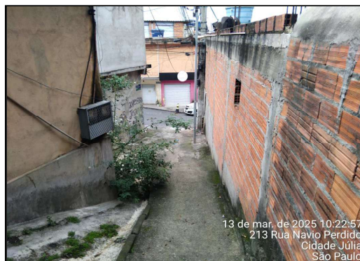
IMAGEM 7 - TRAVESSA SÃO JOAQUIM