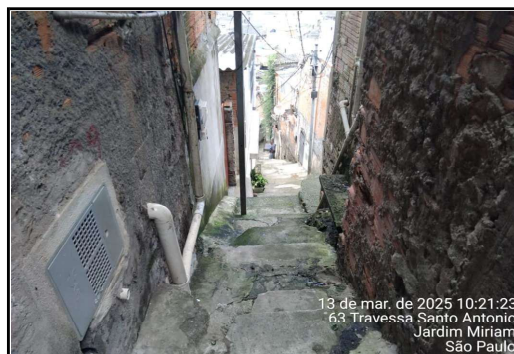
IMAGEM 5 - TRAVESSA SÃO JOAQUIM