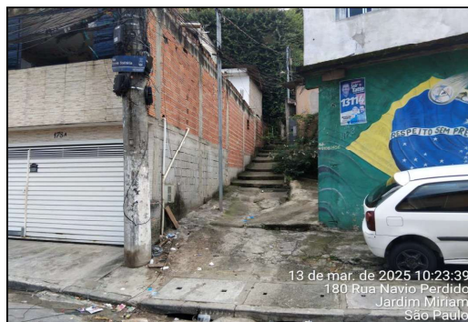
IMAGEM 9 - TRAVESSA SÃO JOAQUIM