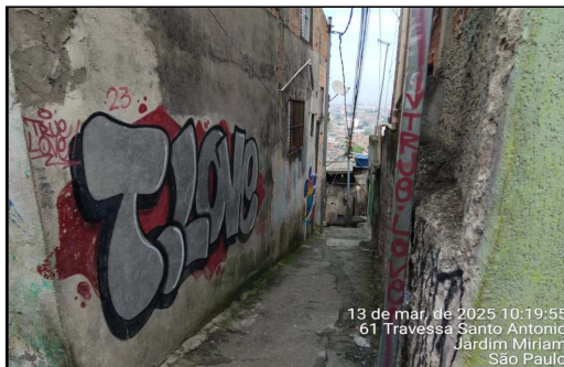
IMAGEM 1 - TRAVESSA SÃO JOAQUIM