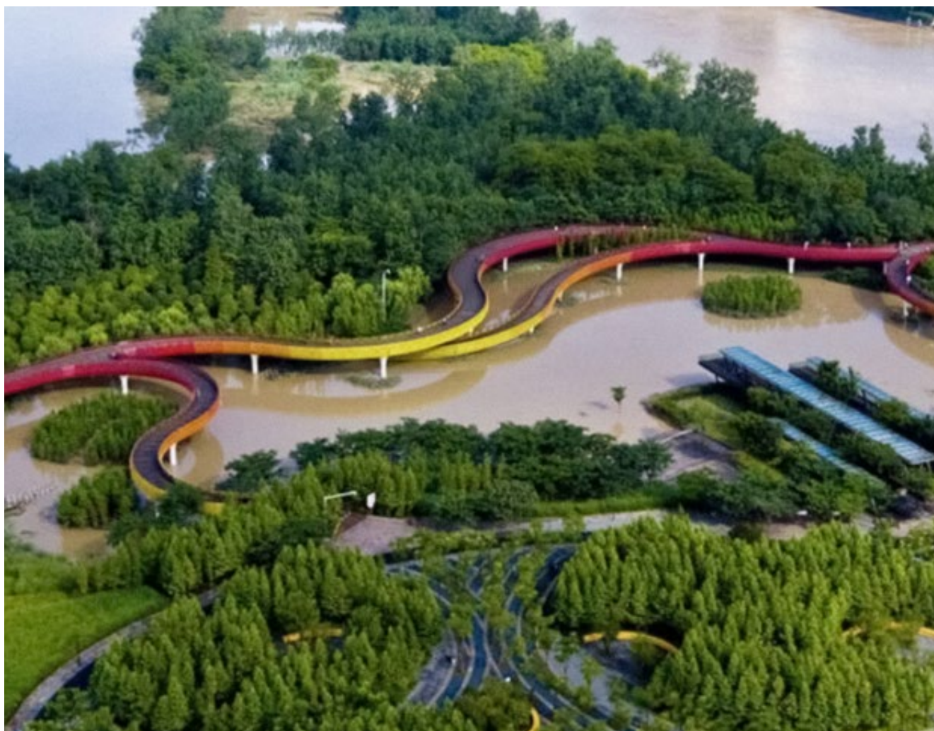
Parque alagável de Yanweizhou, em Jinhua, na China.

florestado urbano, acontece exatamente o contrário durante um temporal, o Coeficiente de Escoamento Superficial fica em torno de 20%, ou seja, cerca de 80% do volume das chuvas é retido na floresta por molhamento, encharcamento e infiltração. Excessiva canalização de córregos e o enorme assoreamento de todo o sistema de drenagem por sedimentos oriundos de processos erosivos e por toda ordem de entulhos de construção civil e lixo urbano compõem fatores adicionais que contribuem para lançar as cidades a níveis críticos de dramaticidade no que se refere a danos humanos e patrimoniais associados aos fenômenos de enchentes.