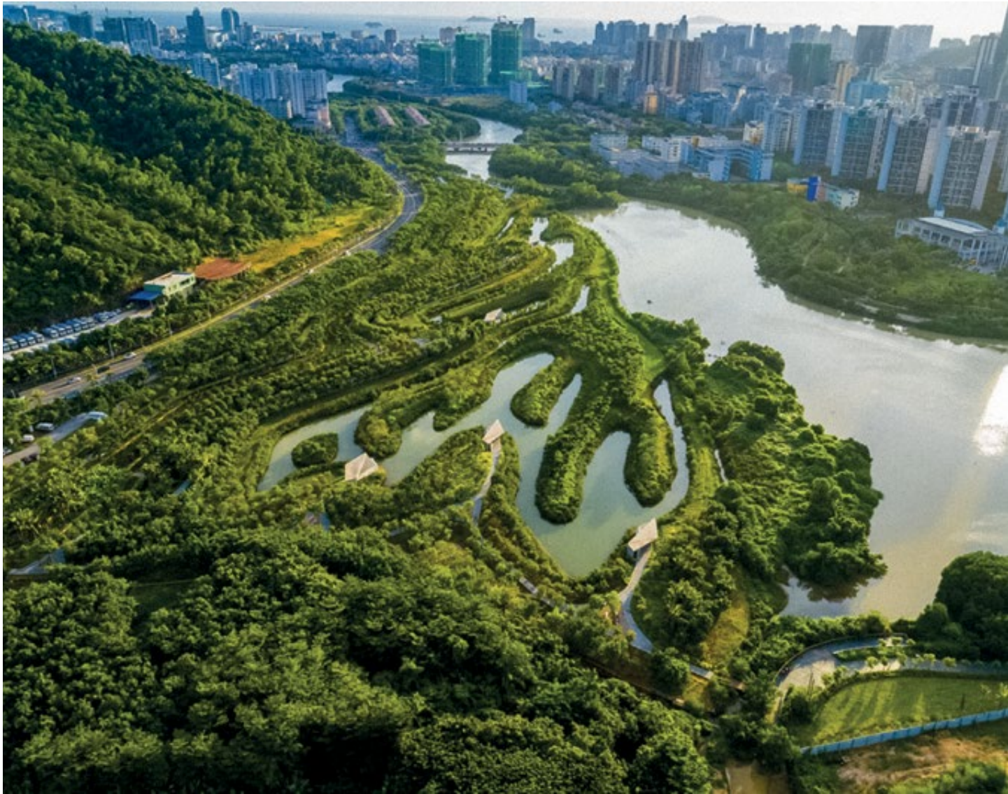
Parque Sanya Mangrove em Hainan, na China.

mede o volume de água que, não sendo retido por infiltração no terreno e molhamentos generalizados, escorre superficialmente em enxurradas em direção aos cursos d'água (o também chamado "run-off"). Como consequências, as inundações, a não alimentação das reservas estratégicas dos aquíferos subterrâneos e a potencialização do diabólico binômio erosão/assoreamento.