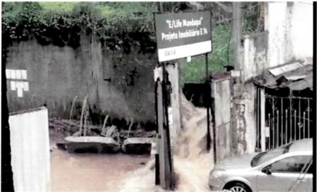
Vazão de água do muro com chuva moderada a forte..