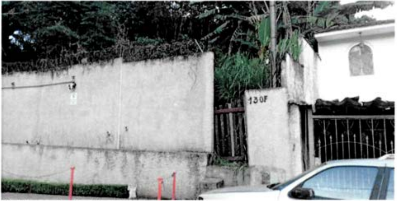
Final da rua José Conhago Pomare atualmente.