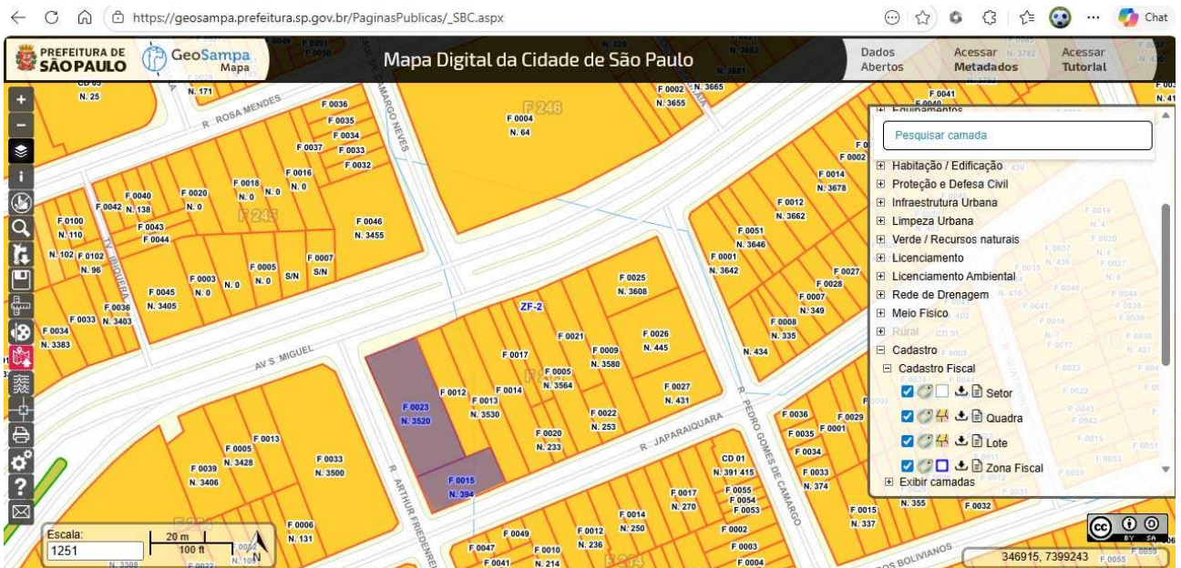
Identificação dos lotes no site : Sistema de Consulta do Mapa Digital da Cidade de São Paulo : em 28/04/2026