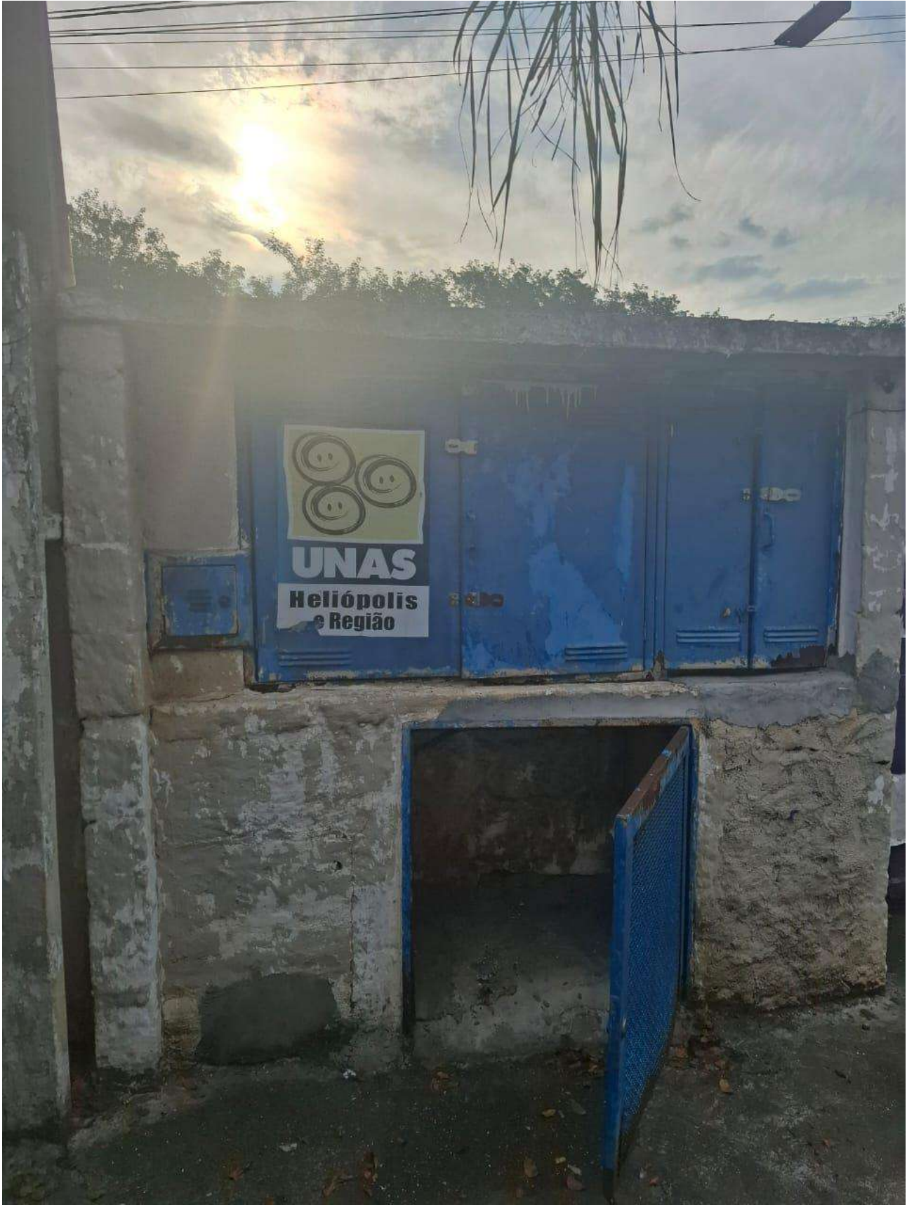
Legenda: Caixa de energia