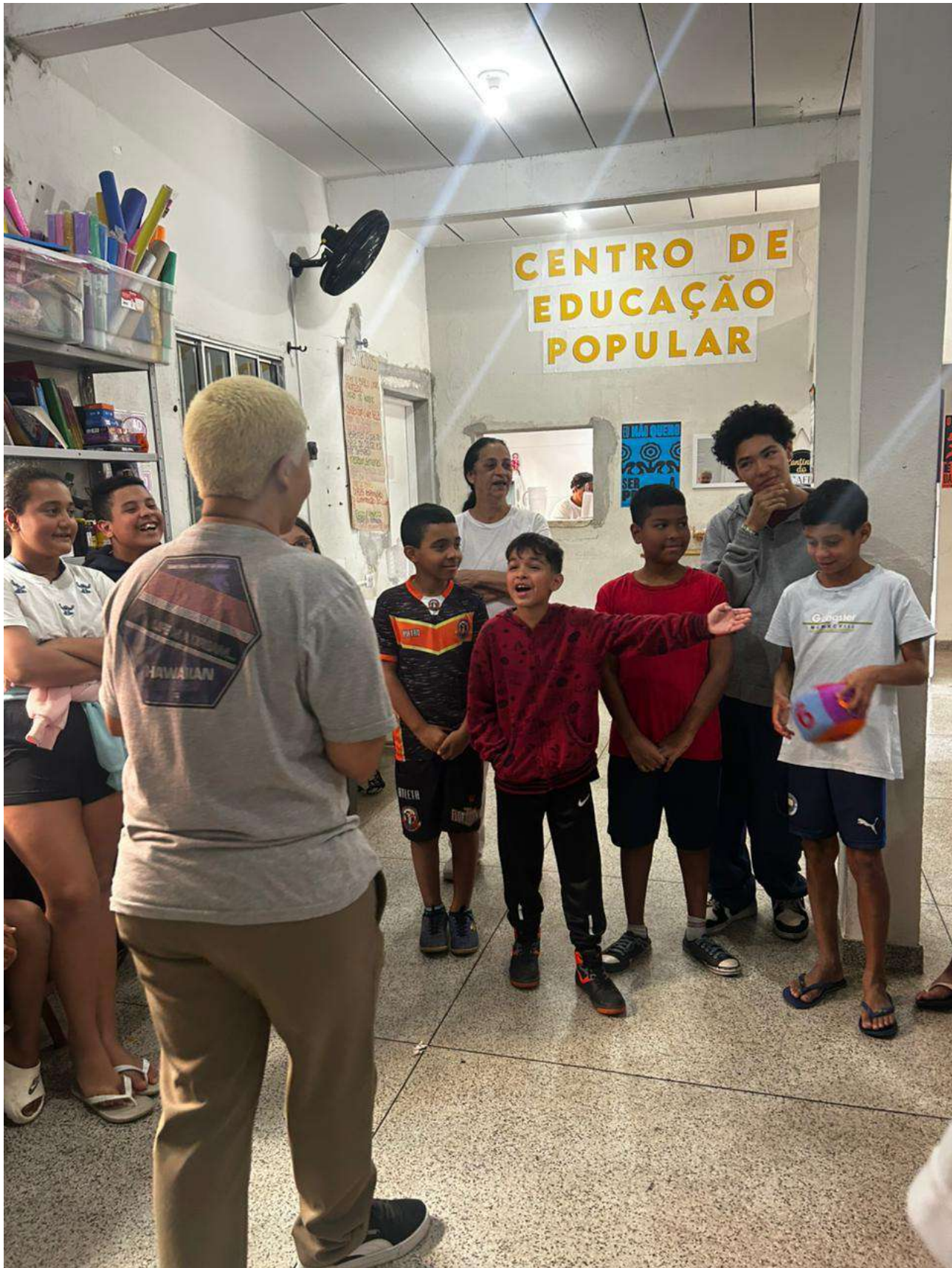
Legenda: Dinâmica - Quebrando Caixinhas - Estereótipos de genero e padrões impostos - Parceiro fios de ouro - Escola de Cabeleireiro Ipiranga