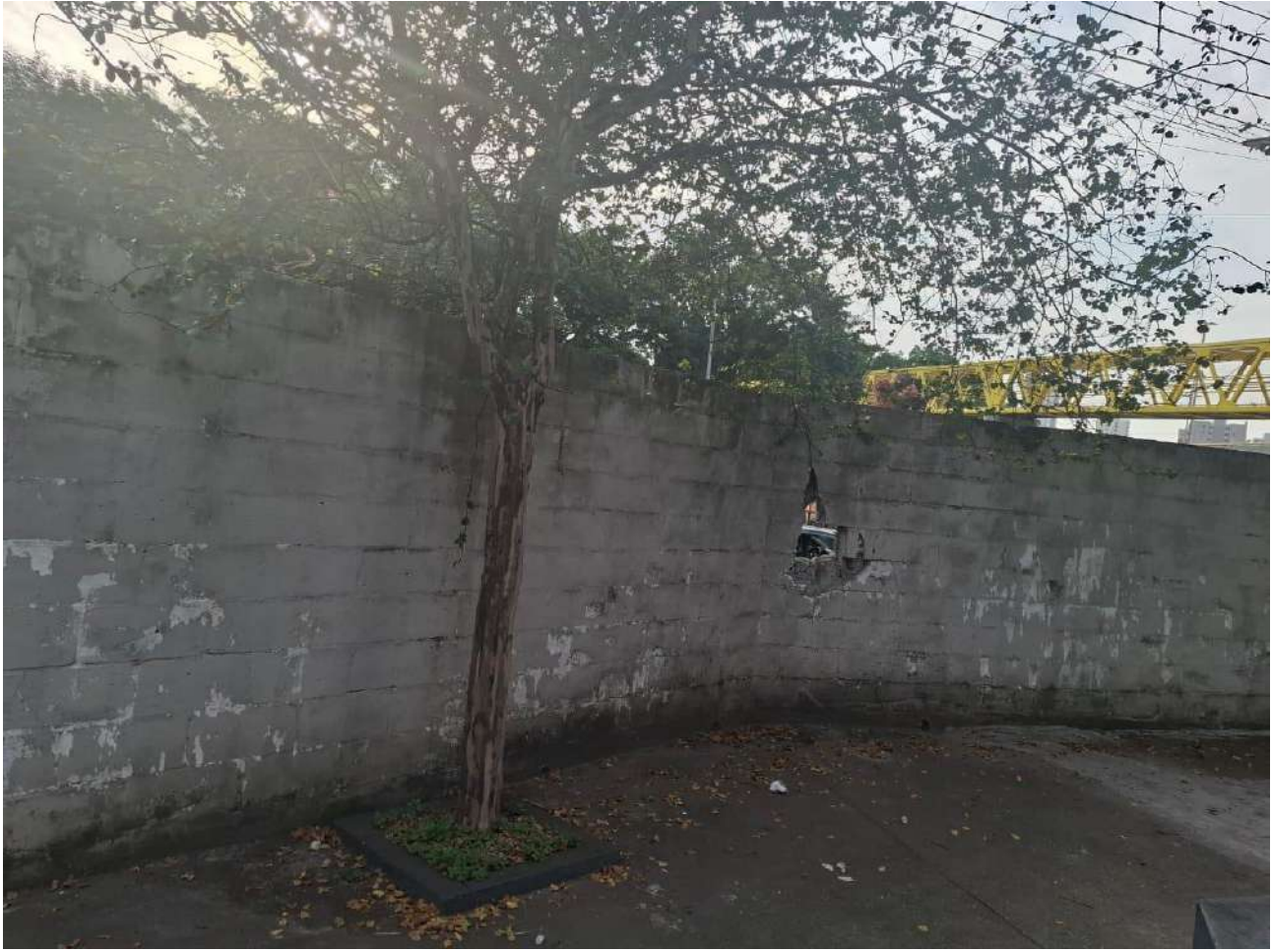
Legenda: Foto detalhada do buraco da área externa