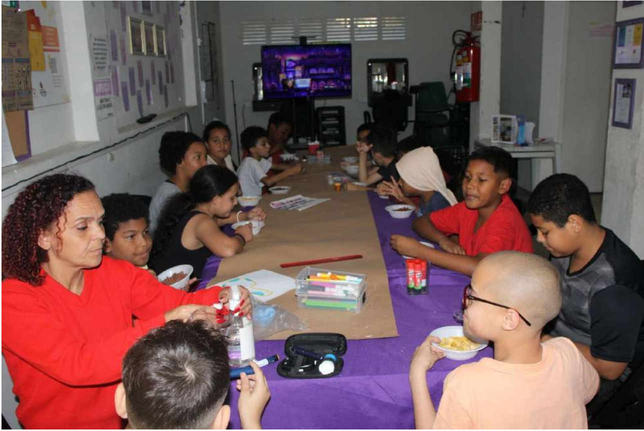
Legenda: Oficina de Empoderamento com as crianças e adolescentes do CCA PAM