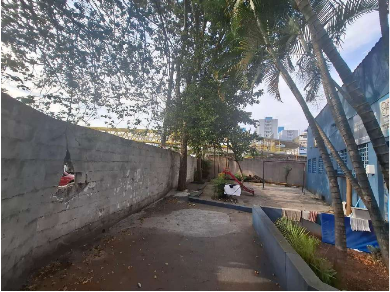
Legenda: Área externa, muro, entrada dos fundos e o parque infantil