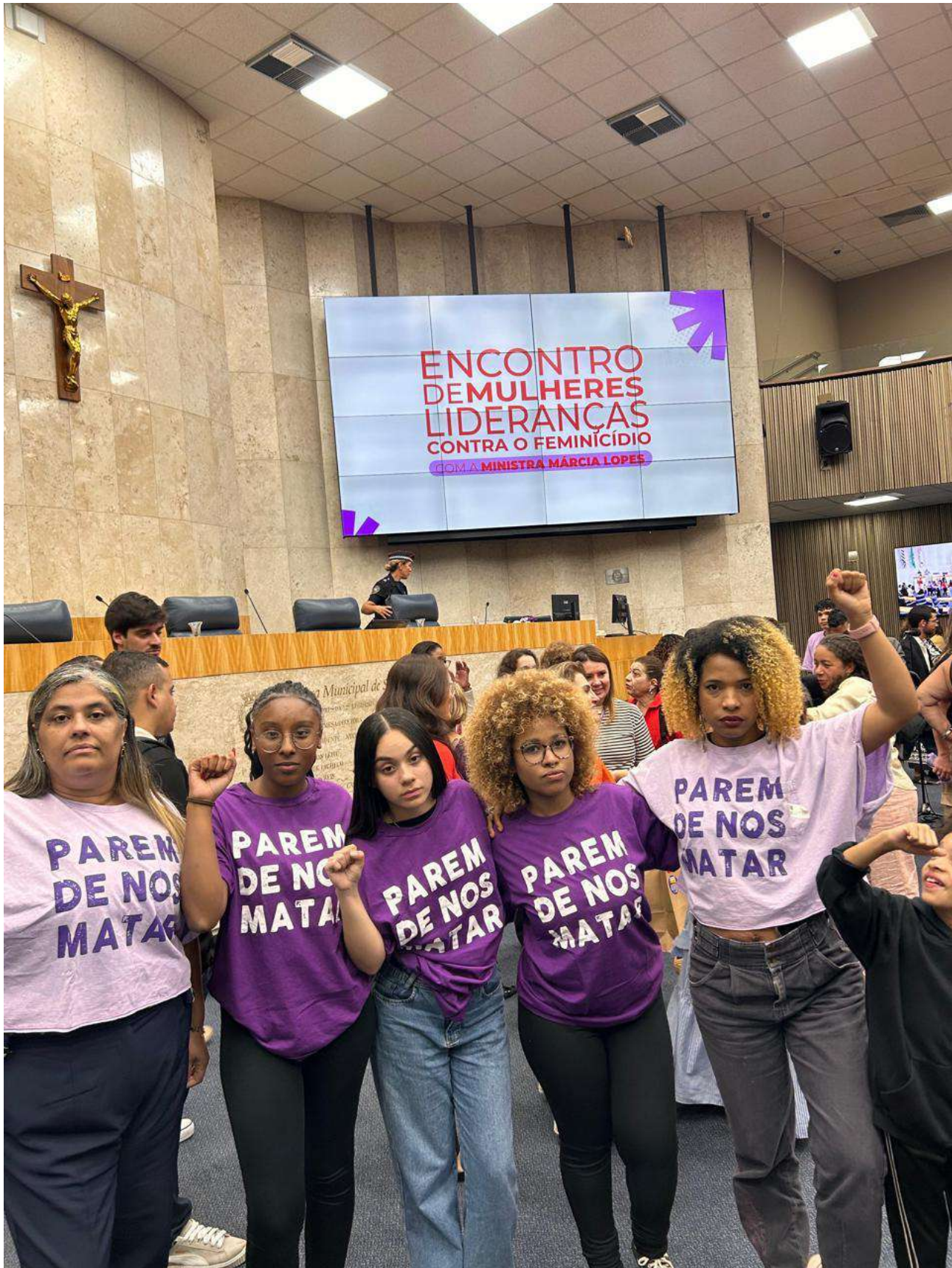
Legenda: Participação no Encontro de Mulheres Contra o Feminicídio com a ministra Márcia Lopes, na câmara municipal do estado de São Paulo