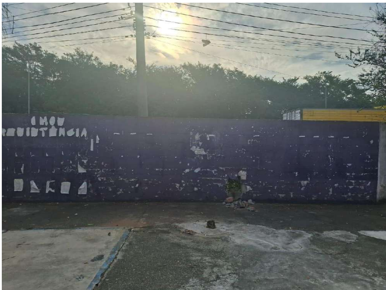
Legenda: Muro da área externa do nosso espaço