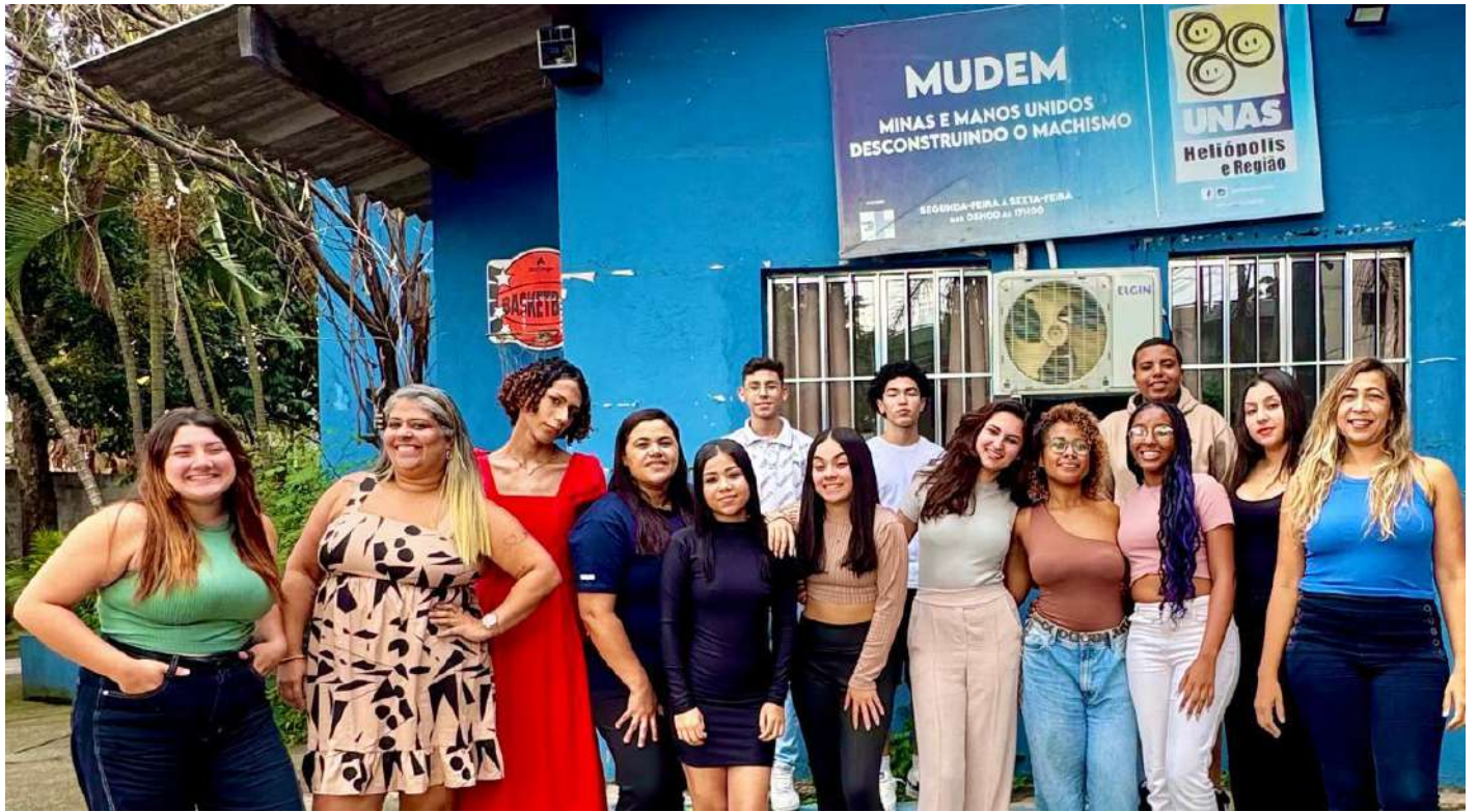
Legenda: Foto Destaque compondo toda a Equipe Técnica e Multiplicadores do Projeto Mudem