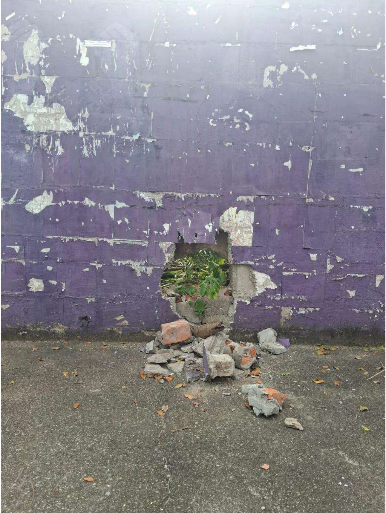
Legenda: Buraco presente no muro da nossa área externa