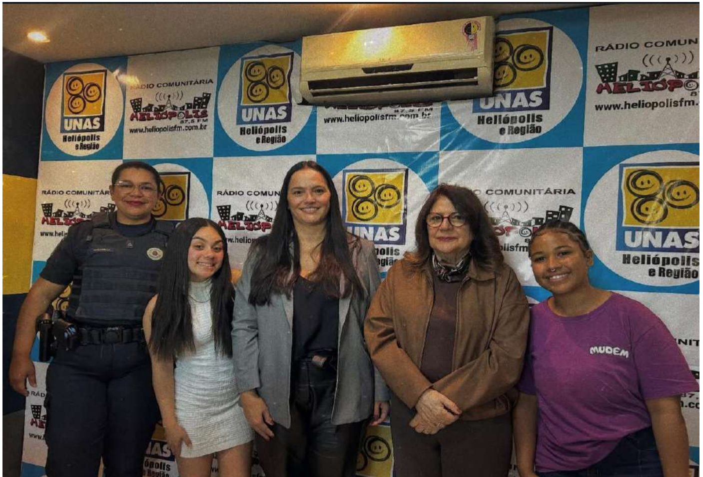
Legenda: Pod Minas e Manos: Um encontro potente de escuta, resistência e fortalecimento dos Direitos Humanos. Mulheres incríveis compartilhando vivências, reflexões e a importância da defesa da vida, da cidadania e da dignidade de todas as mulheres. (presentes a promotora de justiça, deputada estadual e a superintendente da guarda civil metropolitana)