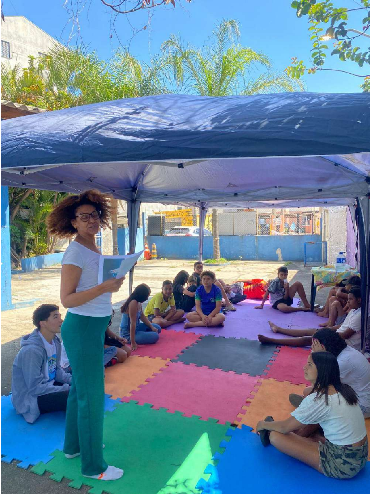
Legenda: Oficina de Autocuidado com as crianças e adolescentes do território