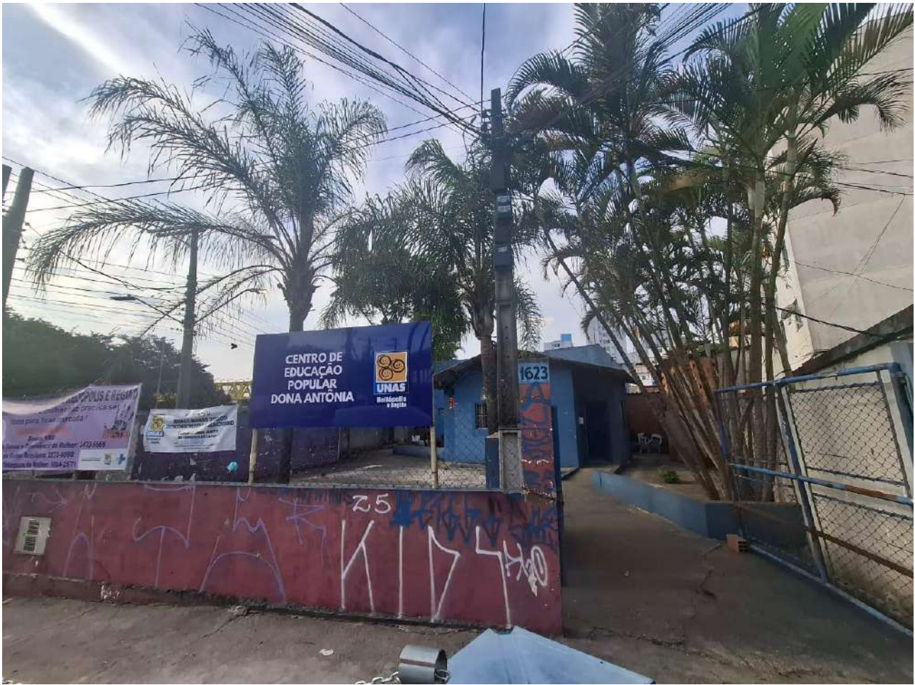
Legenda: Portão de entrada